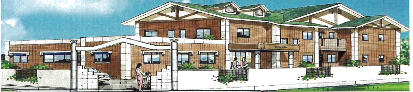
ふるさとのたより姫路

●訪問介護ステーション・デイサービス 体験入居可(お部屋の空き状況があれば対応可)